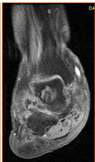
εικ. 2 (T1W-FS)